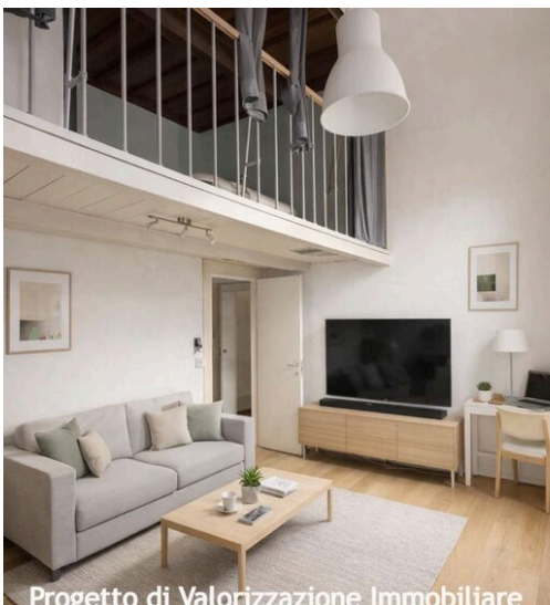
Progetto di Valorizzazione Immobiliare