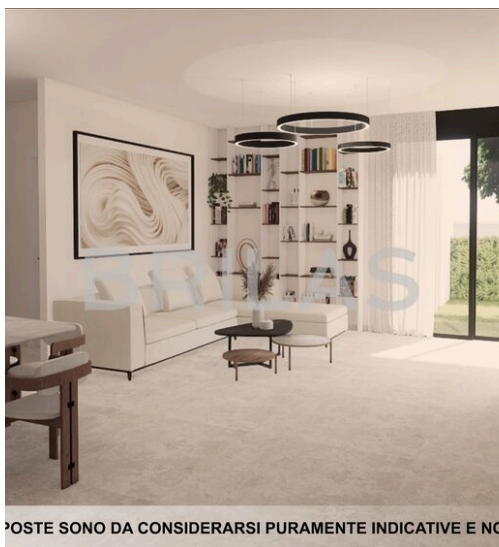
LE IMMAGINI PROPOSTE SONO DA CONSIDERARSI PURAMENTE INDICATIVE E NON VINCOLANTI